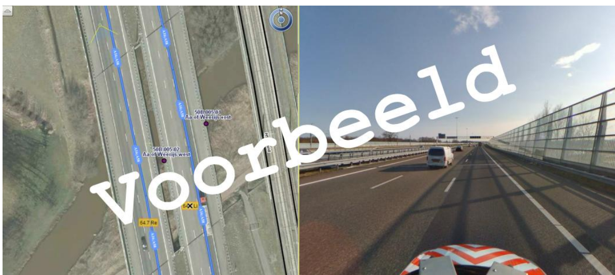
Figuur 1: Overzicht kunstwerk

Objectcode (Top-code): Noteer objectcode [50B-005-02] Objectnaam (Kunstwerknaam): Noteer objectnaam [Aa of Weerij's West] Locatie: Noteer locatie [In RW A16 hm 64.7 Re] Eigenaar beheerobject: Noteer eigenaar [Rijkswaterstaat]